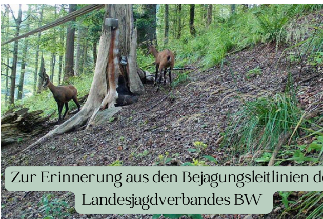
Zur Erinnerung aus den Bejagungsleitlinien des Landesjagdverbandes BW